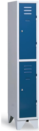
⚠ Model ST21 breed is 400 mm. breed per vlak

Het stalen kastenprogramma van Aestic is een goed alternatief voor de houten kasten. De garderobe- en vakkenkasten zijn er in diverse uitvoeringen. Hierdoor heeft u in dit leveringsprogramma ook vele mogelijkheden. De stalen kasten kunnen geëpoxeerd worden in iedere gewenste RAL-kleur