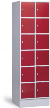
⚠ Model ST43 heeft 12 vakken (4 hoog x 3 breed)

Het stalen kastenprogramma van Aestic is een goed alternatief voor de houten kasten. De garderobe- en vakkenkasten zijn er in diverse uitvoeringen. Hierdoor heeft u in dit leveringsprogramma ook vele mogelijkheden. De stalen kasten kunnen geëpoxeerd worden in iedere gewenste RAL-kleur