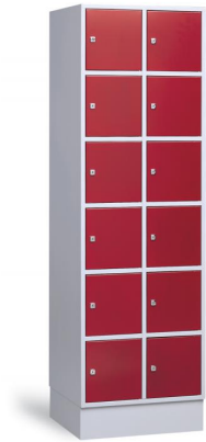
⚠ Model ST61 heeft 6 vakken (6 hoog x 1 breed)

Het stalen kastenprogramma van Aestic is een goed alternatief voor de houten kasten. De garderobe- en vakkenkasten zijn er in diverse uitvoeringen. Hierdoor heeft u in dit leveringsprogramma ook vele mogelijkheden. De stalen kasten kunnen geëpoxeerd worden in iedere gewenste RAL-kleur